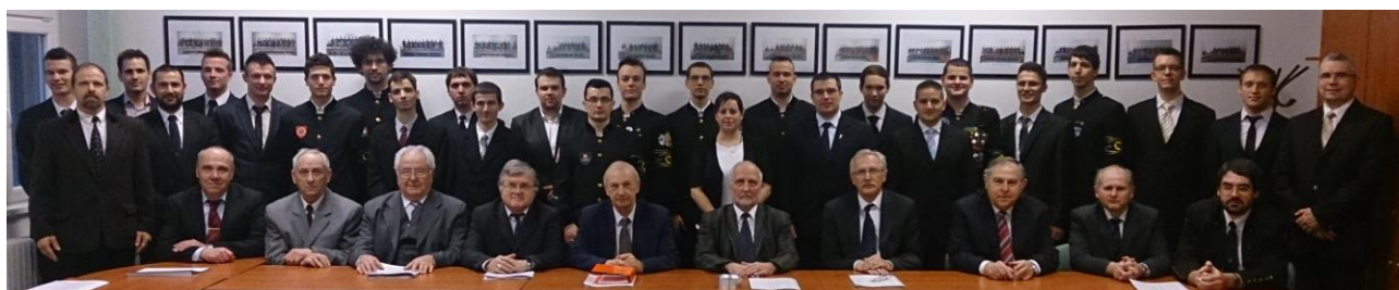
Hallgatóink és a vizsgabizottság egy sikeres Záróvizsga után